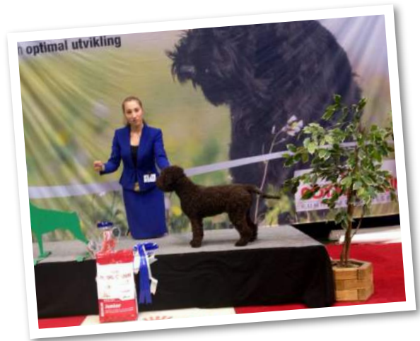
Gleska Miss Behaving (Gleska Goody Two Shoes x Rozebottel's Big Spender) BIS 4 for judge Rob Douma in Letohallen!