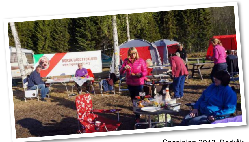
Spesialen 2013, Berkåk