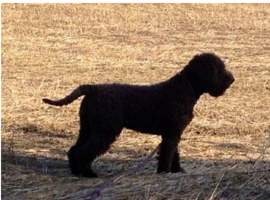
Deilig på utstilling i Letohallen. Noa BIR valp Løping på jordene på Råholt